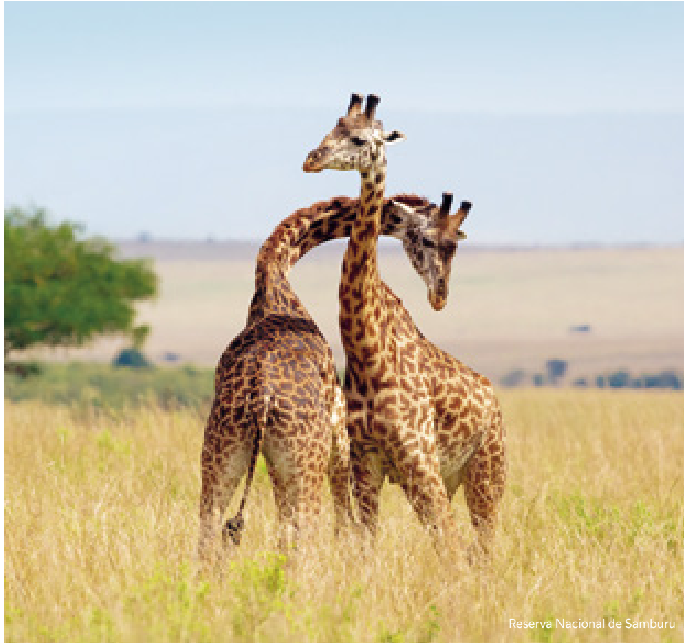
Reserva Nacional de Samburu

Programa de 7 noches visitando Nairobi, Samburu, Montes Aberdare, Lago Nakuru y Masai Mara