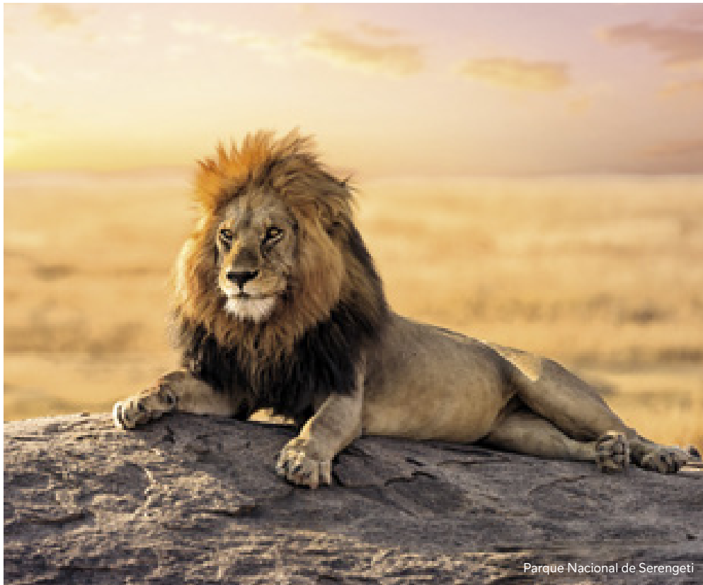
Parque Nacional de Serengeti

Programa de 7 noches visitando Arusha, Tarangire, Lago Manyara, Ngorongoro (Karatu), Serengeti y Nairobi