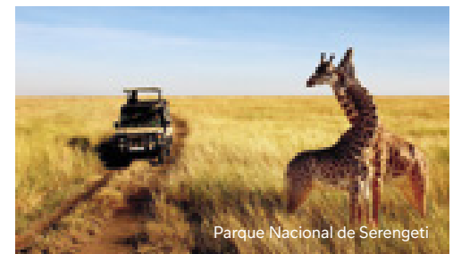
Parque Nacional de Serengeti

Nairobi: Eka Hotel, Tamarind Tree o Southern Sun Mayfair Hotel Nairobi (4*)