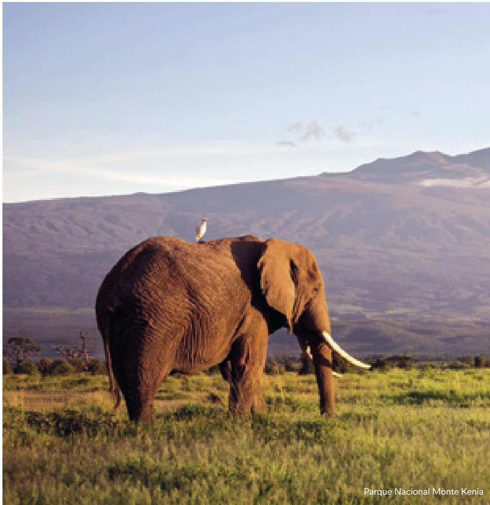
Parque Nacional Monte Kenia

Programa de 7 noches visitando Nairobi, Monte Kenia, Lago Naivasha, Lago Nakuru y Masai Mara