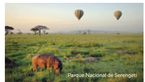
Parque Nacional de Serengeti

Nairobi: Eka Hotel (4*), Tamarind Tree (4*) o "Southern Sun Mayfair" (4*)