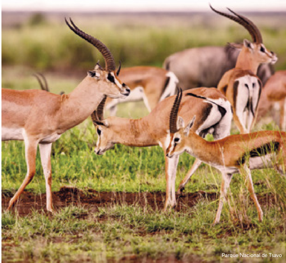
Parque Nacional de Tsavo